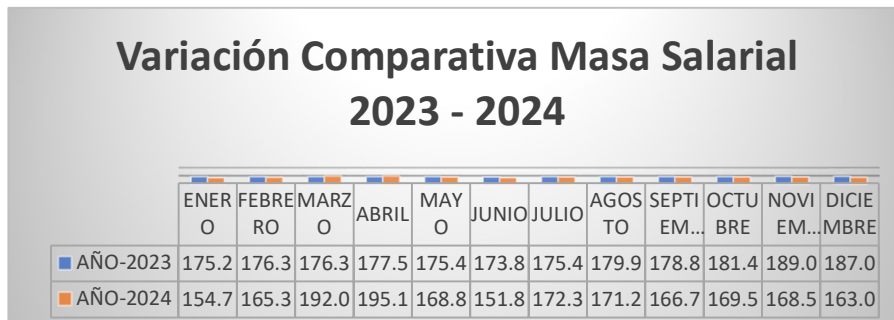
Ilustración 1: Variación de masa salarial

Fuente: Coordinación General Administrativa Financiera Elaboración: Dirección Administrativa