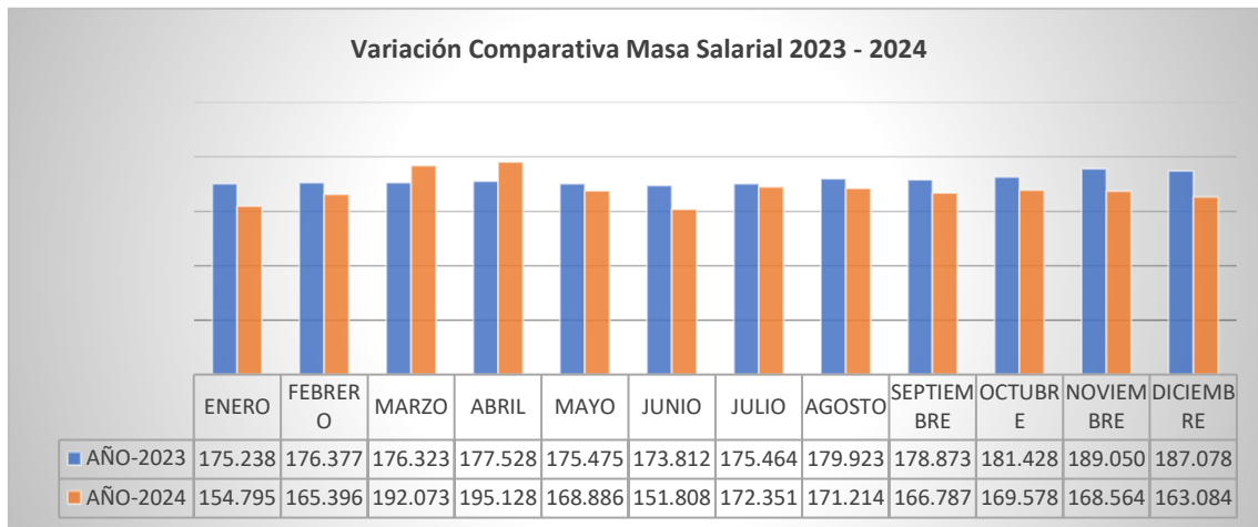
Ilustración 1: Variación de masa salarial

Fuente: Coordinación General Administrativa Financiera Elaboración: Dirección Administrativa